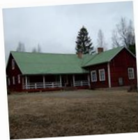
Tikkalan Nuorisoseura Pyrintö ry

Ahtialan-Koiskalan Nuorisoseura ry Lahti