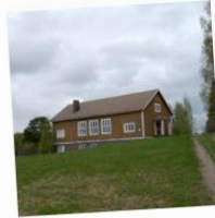
Urajärven Nuorisoseura ry