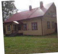
Suopellon Nuorisoseura Kulo ry